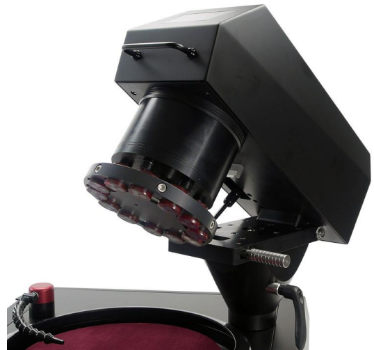
작업에 용이한 틸트업 방식