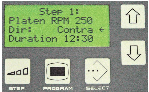
25개의 메뉴 저장 가능