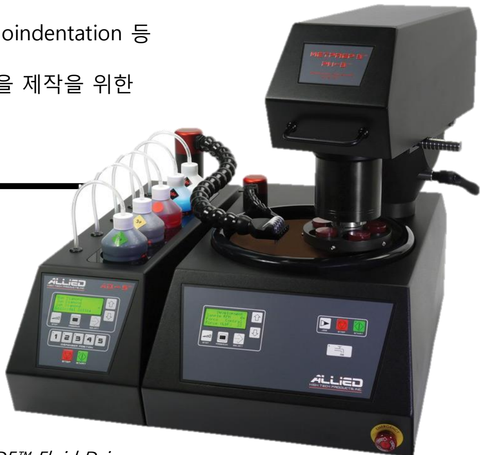
AD5™ Fluid Dispenser