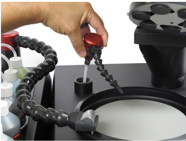
물 노즐 분리 가능(세척 용이)