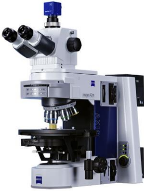
ZIESS Axio Imager.A2m